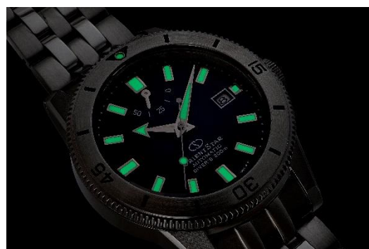
針とインデックスに施されたルミナスライト