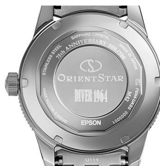
アニバーサリーマークおよび シリアルナンバー刻印